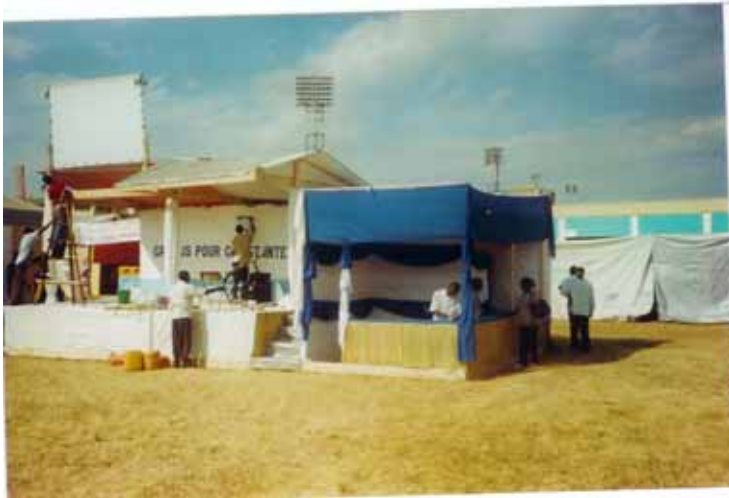
Ce stand était construit au centre Est du parcelle de l'expo

Le stand de CPC était conçu pour permettre l'évangélisation à plusieurs formes. C'est pourquoi 8 stratégies d'évangélisation ont été mises sur pied et tous devraient avoir pour point central le "stand". Le stand avait une cave qui servait de stock, deux chambres, une pour l'affermissement, l'autre pour l'intercession. Les stratégies développés sont: